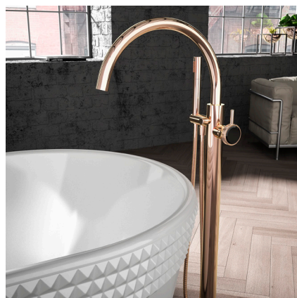
JÖRGER, Serie Valencia, freistehende Wannen-Armatur in Rosé-Gold

JÖRGER ARMATUREN- UND ACCESSOIRES-FABRIK GMBH Seckenheimer Landstraße 270-280 68163 Mannheim / Germany