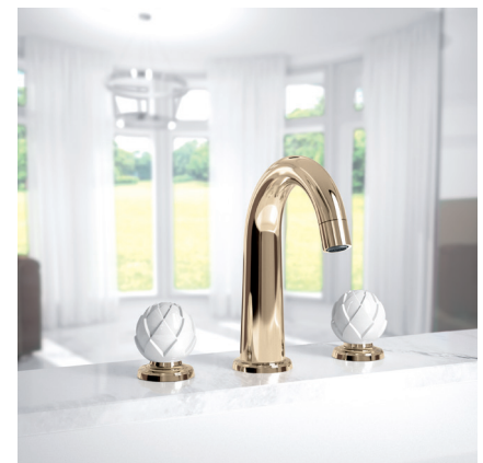
JÜRGER, Serie Belledor, 3-Loch Waschtisch-Armatur in Edelmessing mit weißen Porzellangriffen