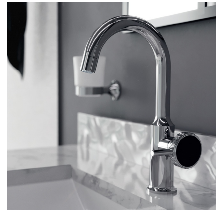
JÜRGER, Serie Valencia, 1-Hand Waschtisch-Armatur in Chrom

Porzellanblüten als Schmuckelemente kennt man seit Jahrhunderten in der gehobenen Tischkultur. Dass diese ihre besondere Ausstrahlung auch bei einer Armaturen- und Accessoires-Serie entfalten, zeigt die exklusive Kollektion „ Belledor “. Mit ihrem klaren, zeitlosen Design kombiniert mit eleganten Porzellangriffen in Form einer Blüte greift die Kollektion kontrastreiche Stilmittel auf und verbindet sie zu einem innovativen Kunstobjekt. Die hochwertigen Porzellanelemente werden in der traditionsreichen Porzellanmanufaktur Fürstenberg gefertigt, um die außergewöhnliche Qualität sicherzustellen.