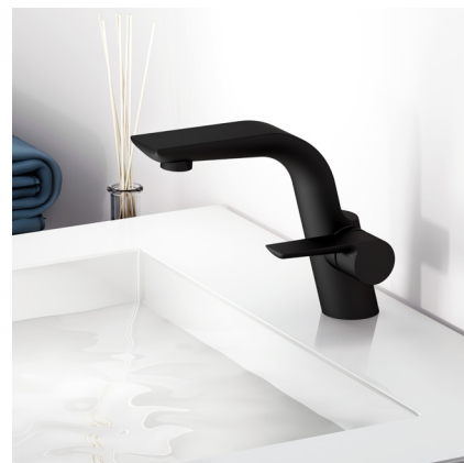
JÖRGER, Serie EXAL, 1-Hand Waschtisch-Armatur in schwarz matt

Neben der Schutz- und Hygienefunktion kommt der Oberfläche eine besondere Bedeutung zu: Sie lässt das Design der Armatur aufleben. Jörger überzeugt mit einer Vielzahl von Oberflächen, die den individuellen Stil der Armaturen und Accessoires unterstreichen und Spielraum für jeden Geschmack bieten. In diesem Jahr stellt das Traditionsunternehmen als neue Farbvarianten den warmen Trendton Rosé-Gold, auch in matt, sowie Schwarz und Weiß in mattem Finish vor.