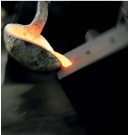
Speziell legiertes Messing

Bei Jörger ist das ähnlich. Wir erhalten aus ganz Europa Einzelteile für unser Verkaufsprogramm. Wichtig aber ist: Das Design und die Werkzeuge gehören uns! Zulieferteile werden nach unseren Vor- und Angaben gefertigt, werden von uns weiterbearbeitet, geschliffen und veredelt. Die Endkontrolle der Produkte liegt bei uns. „Made in Germany“ bedeutet für Jörger: Manufaktur und endgültige Fertigstellung bei uns in Mannheim.