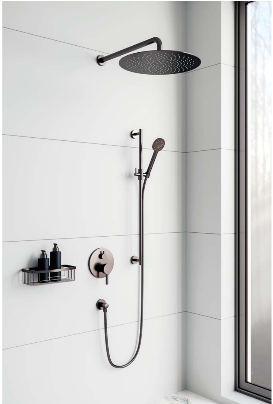
CHARLESTON ROYAL – Duschkombination und Schwammkorb in Nerz matt

Für die universell einsetzbare Kombination aus Unterputz-Einbaubox und Funktionseinheit gibt es Sichtteile, die serienspezifisch auf das jeweilige Armaturendesign abgestimmt sind. Der zurückhaltend gestaltete Träger lässt sich funktionssicher mit der technischen Grundeinheit verbinden.